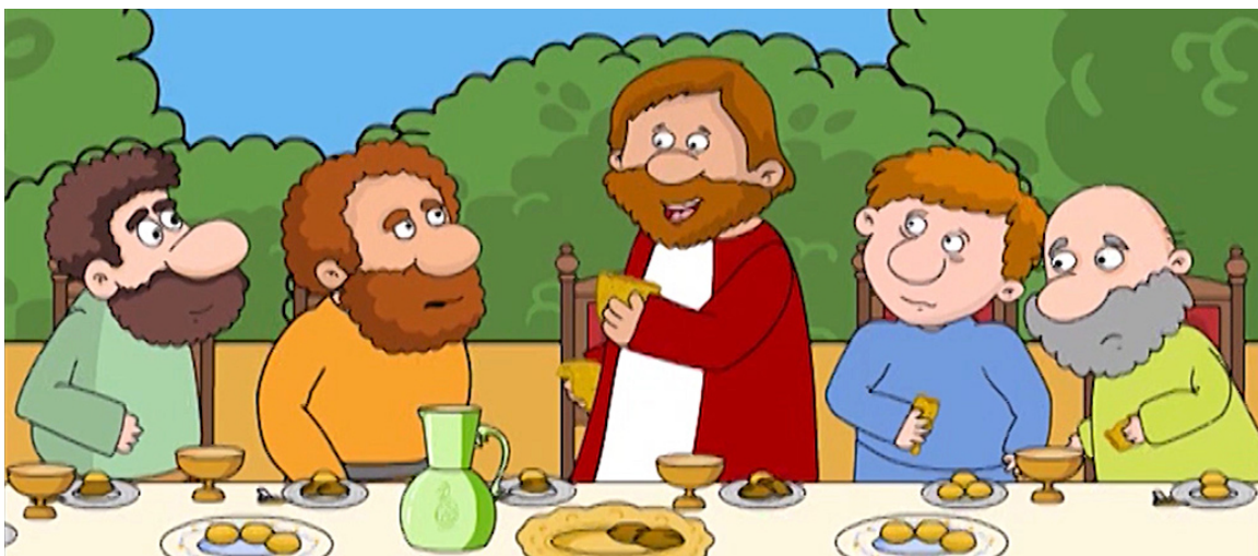
Beim "Letzten Abendmahl" gab Jesus seinen Freunden das Brot. Dabei sagte er: "Das ist mein Leib".

Wenn heute dann ein Priester diese Worte von Jesus spricht, dann werden das Brot zum Leib und der Wein zum Blut von Jesus. Denn wie alle Menschen bestand ja auch Jesus aus Fleisch und Blut. Das heißt also, dass Jesus in der Eucharistie nicht nur in unserer Erinnerung bei uns ist. Er ist wirklich bei uns! Und genau das feiern wir Katholiken an Fronleichnam. Dabei ist es auch nicht schlimm, dass wir ihn nicht sehen, riechen oder schmecken können. Denn Jesus selbst hat uns und seinen besten Freunden versprochen, dass er da ist.